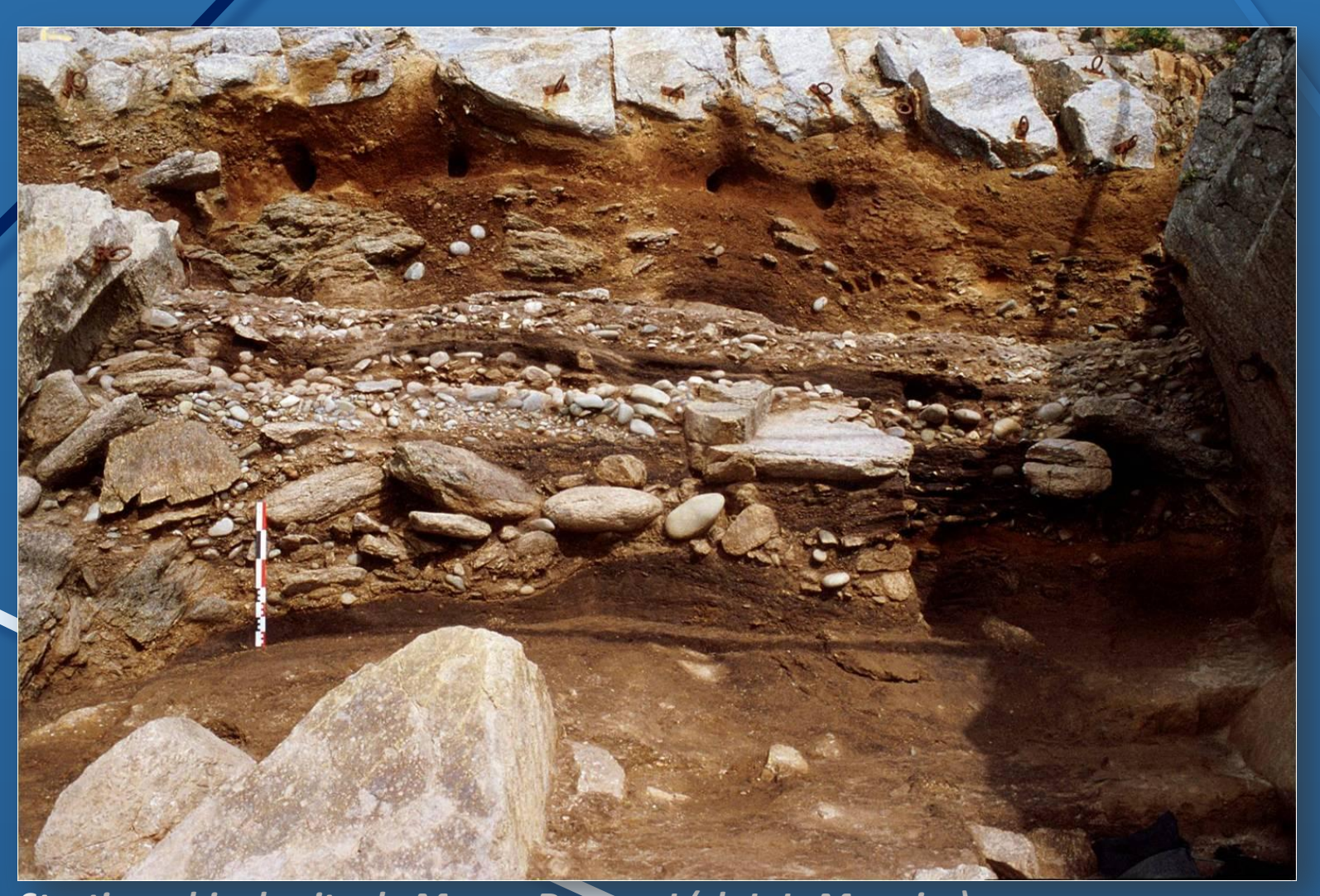
Stratigraphie du site de Menez-Dregan I

Lors de l'occupation du site de Menez-Dregan, le niveau marin était bien plus bas que l'actuel, libérant une vaste plaine à la place de la baie d'Audierne. Ce paysage a permis aux pré-néandertaliens qui vivaient à Menez-Dregan de charogner ou chasser les gros herbivores qui s'y trouvaient. Ces grands espaces exondés sont cruciaux pour la compréhension des peuplements paléolithiques, car de nombreuses îles étaient alors rattachées au continent, et accessibles à pied.