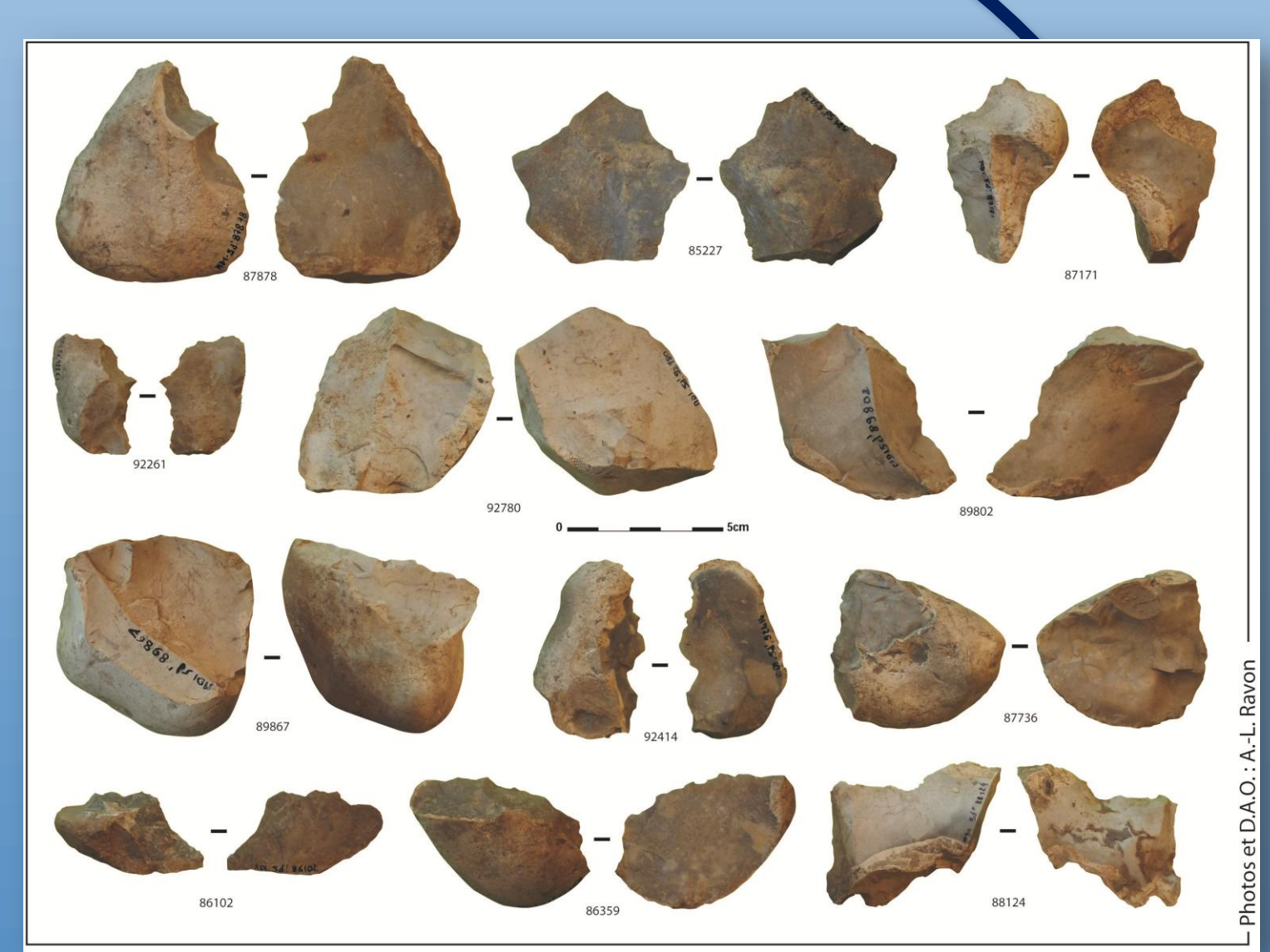
Macro-outillage de la couche 4 (DAO A.-L. Ravon)

L'industrie lithique retrouvée sur le site correspond au faciès Colombanien, un faciès du Paléolithique inférieur contemporain de l'Acheuléen mais distinct typologiquement car le macro-outillage est essentiellement représenté par des galets taillés. Les matières premières sont prélevées directement sur le site ou sur les plages environnantes et deux chaînes opératoires sont bien distinctes dès le stade de leur collecte. Les petits galets de silex sont surtout destinés au débitage à dominante « clactonienne » (talons larges rarement facettés, bulbes proéminents, angles d'éclatement très ouverts), parfois sur enclume, jamais Levallois.