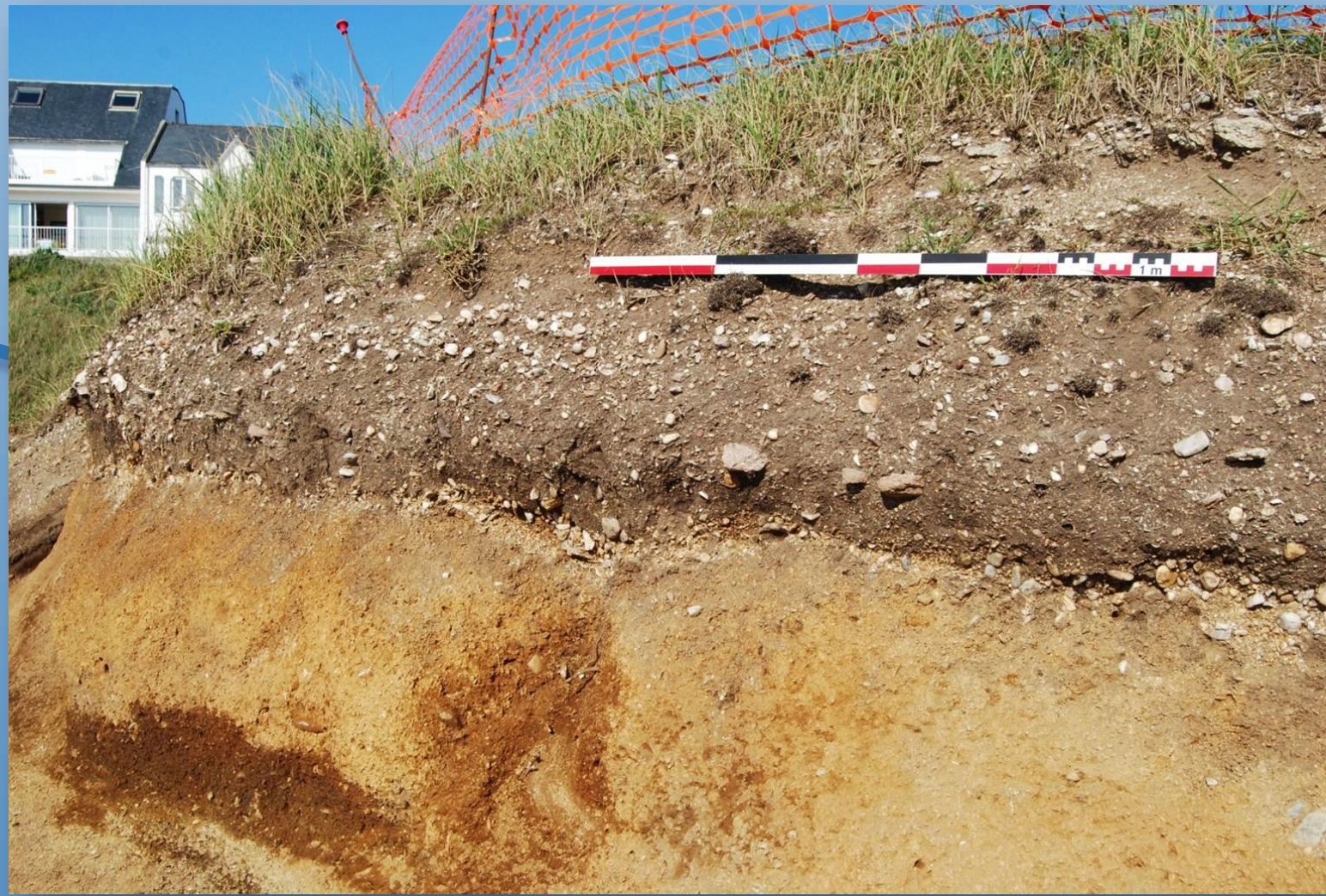
Vue du dépotoir coquillier au-dessous de la dune et au-dessus de la plage ancienne

Découvert par G. Bernier en 1970 à l'extrémité sud de la presqu'île de Quiberon, le site de Beg-er-Vil est installé au sommet d'une falaise actuelle, à environ 3 m au-dessus des plus hautes mers. Il a été sondé en 1985 puis fouillé de 1987 à 1988 par O. Kayser sur une surface totale de 23m 2 . Depuis 2012, la reprise de la fouille de ce site de référence pour la fin du Mésolithique dans l'Ouest de la France est liée à sa mise en péril par l'érosion marine et la pression anthropique.