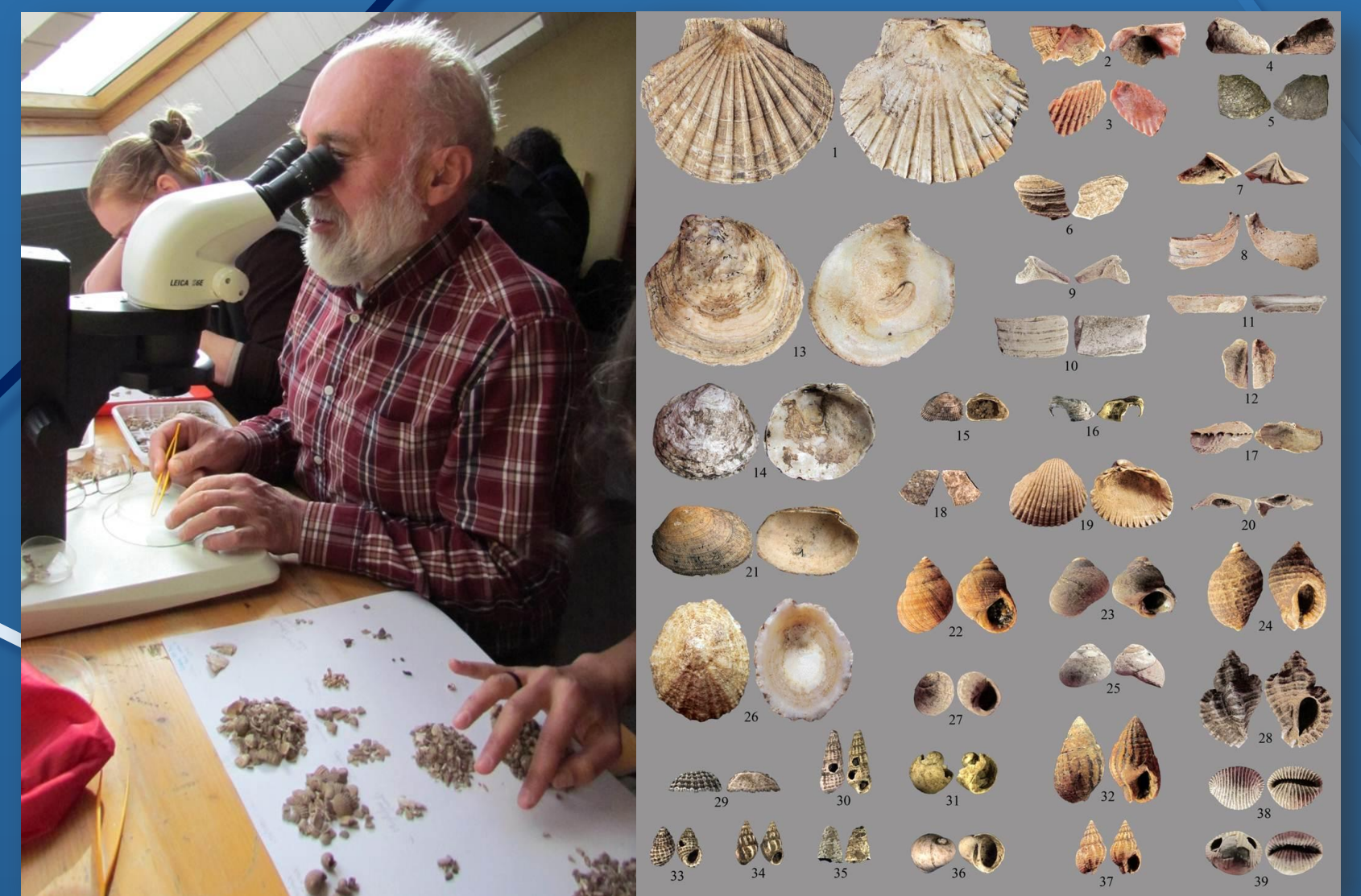
Le tri du dépotoir coquillier et les coquillages marins identifiés

La variété des ressources marines exploitées correspond à un comportement opportuniste d'une population qui n'a pas hésité à profiter de la diversité que présentaient les environnements proches.