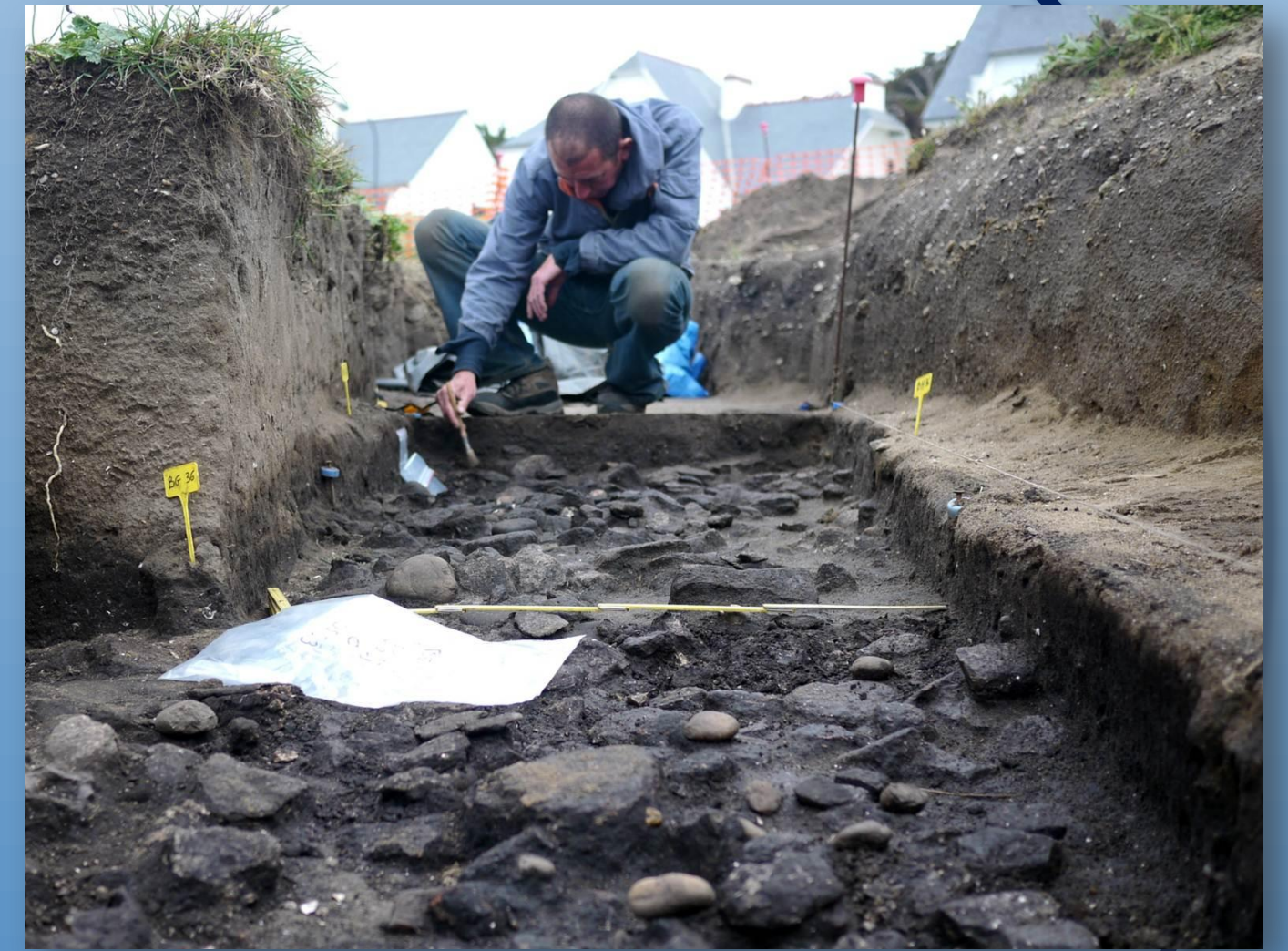
Fouille du niveau de pierres découvert sous le dépotoir coquillier

Le site a été partiellement protégé par une dune peu épaisse. Au Mésolithique, le climat était sensiblement le même qu'aujourd'hui, mais le niveau marin était inférieur d'une quinzaine de mètres. Le site mésolithique est installé aujourd'hui au sommet d'une petite falaise, sur une plage fossile bien antérieure (Pléistocène), mais il devait se trouver à l'époque bien plus en retrait de la mer, sur une faible pente.